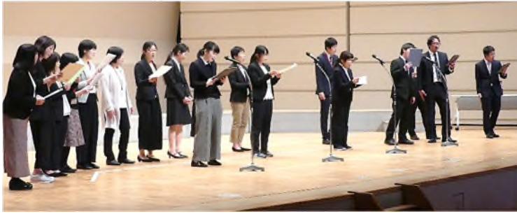
▲先生方から歌のプレゼント！熱唱に拍手喝さい！！

保護者の皆様におかれましては、新型コロナウイルス感染拡大防止のため、無観客での開催と PTA 合唱の中止にご理解ご協力いただきましてありがとうございました。今回、合唱コンクールの様子を業者に収録していただきました。後日、希望者の方に音楽著作権処理を行った DVD の販売をご案内する予定で準備を進めています。詳細は、後日案内文書を配布します。