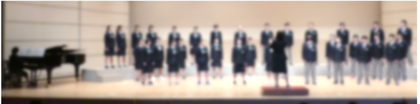
▲最優秀賞 3年1組「手紙～拝啓十五の君へ～」