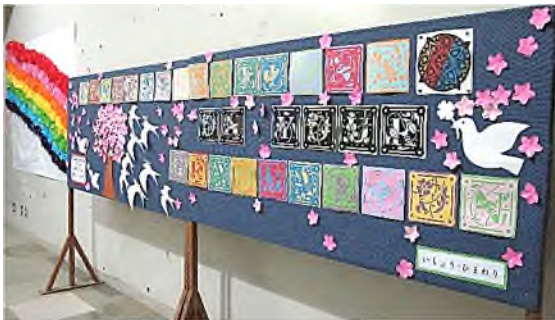
いちよう・ひまわり組が作ったお祝い装飾